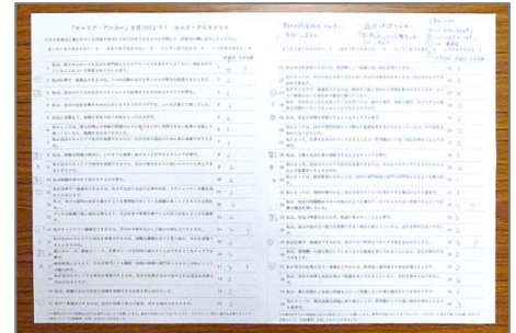
自己採点の用紙はこんな感じです

それぞれについて解説を読み、見直した後に、キャリアヒストリー分析を行いました。こちらは過去の学歴や職歴について設問を読み(またはインタビュー形式で)回答していき、その回答から上記8つの領域のどれが高いか記入します。