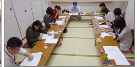
セルフアセスメントをしています