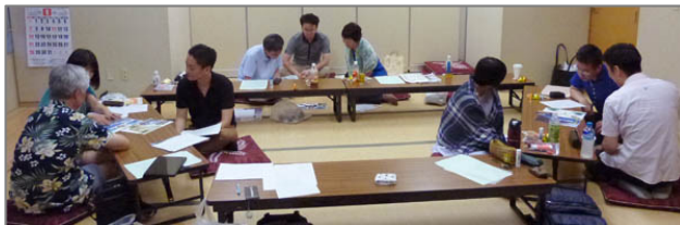
傾聴インタビューをやってます

作品が出来上がったら、その作品について傾聴インタビューしていきます(10分間)。作品のタイトルや作ってみての感想、気に入っている切り抜きや、作る過程で考えたこと、浮かんできたイメージなど、交代で聴いていきます。