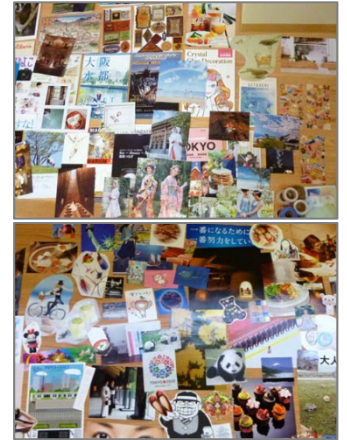
いろんな素材があって楽しいです

作品が出来上がったら、その作品について傾聴インタビューしていきます(10分間)。作品のタイトルや作ってみての感想、気に入っている切り抜きや、作る過程で考えたこと、浮かんできたイメージなど、交代で聴いていきます。