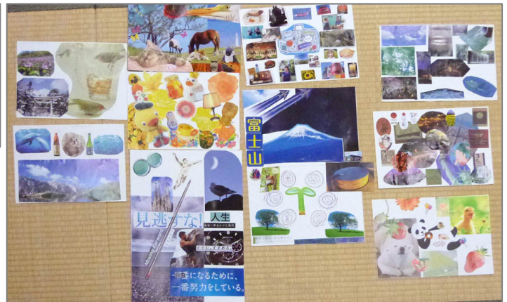
出来上がった作品。どれが誰のかわかります？

その後はコラージュ療法の効果や見方について学んだり、さらに他の人の作品を見て意外だったり、納得したり。コラージュそのものも楽しいと好評でした！！