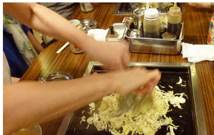
もんじゃを焼いています

鉄板でもんじゃなどを焼いたりしながら、海からの景色を楽しみました。皆さん「OOが見える！」とはしゃいでました(笑)