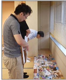
素材を選んでます