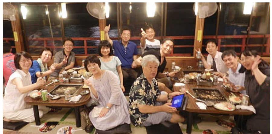
盛り上がってます！