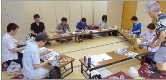
皆さん作業中。けっこう真剣かも？