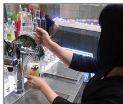
ビアサーバーがあります。