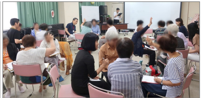
話し手・聴き手・観察者を体験して頂きました。