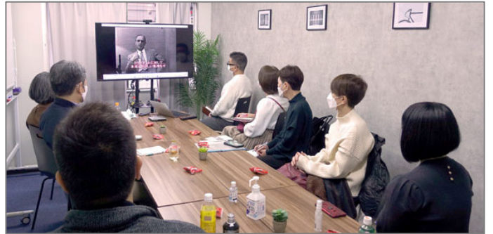
今回は10名参加。ビデオを視聴しているところです。

視聴した全員の感想がこちらです。いろいろな感想があつて面白いです。私は声や姿勢などが想像と違って意外でした。