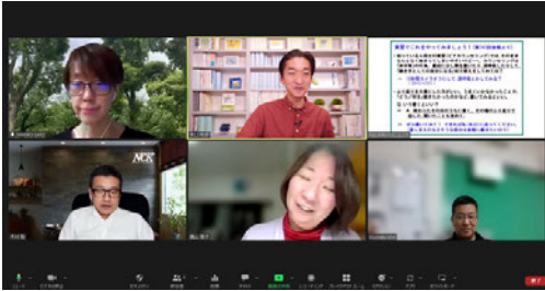
5名参加。ふり返り中です。