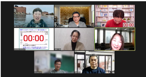
7名参加。全体でのふり返り中です。