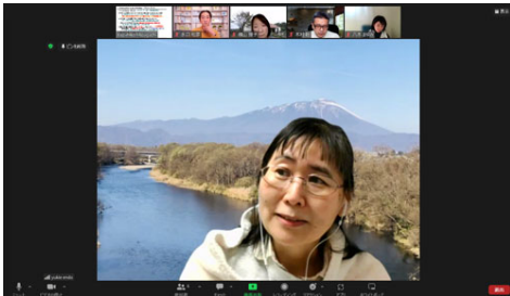
今回のワークは5名参加。 ワーク中の様子です。

2/18の勉強会はおなじみの『フラッシュワーク(閃く練習)』を行いました。カウンセリングでの伝え返しを練習するワークです。今回は参加者が5名で、ワークを6回行いました。