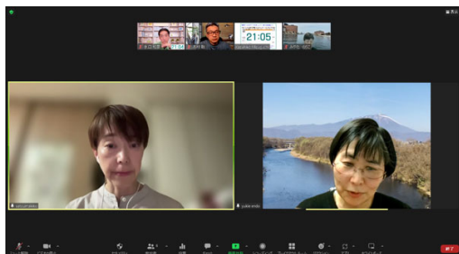
実習中の画面です。 「ピンを追加」でCOとCLを並べて表示しています。