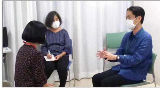
6名参加。2グループで行いました。