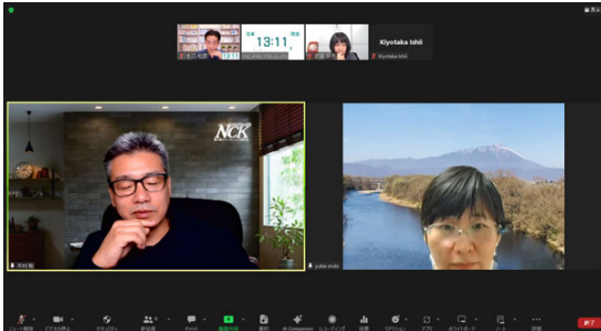
実習中の様子です。