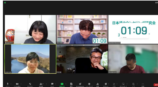
5名参加。ふり返りしているところです。